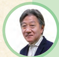
鈴木 英史 (作曲家)