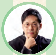
瀬尾 宗利 (指揮者)